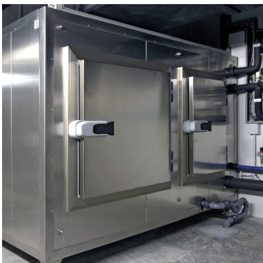
model / modelo HATCHES / VENTANILLO

HATCHES FOR RETAIL & INDUSTRIAL COLD STORAGE.