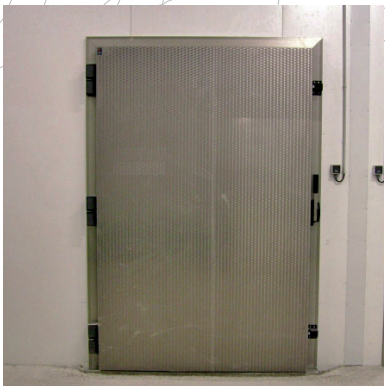
model / modelo OVERLAP - SOB / SUPERPUESTA