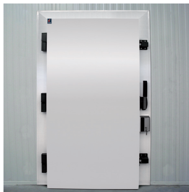
model / modelo OVERLAP - TFP / SUPERPUESTA