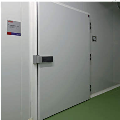
model / modelo REBATED - ENC / ENCAJADA

FRÍO INDUSTRIAL. CÁMARAS DE CONSERVACIÓN Y CONGELACIÓN, SECADEROS.